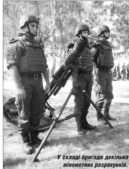
У складі бригади декілька мінометних розрахунків.